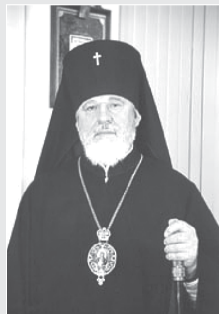
Архиепископ Самарский и Сызранский Сергей

13 декабря Самарский государственный технический университет посетил архиепископ Самарский и Сызранский Сергей. В актовом зале университета состоялась открытая лекция владыки для студентов на тему «Миссия Русской православной церкви в наши дни».