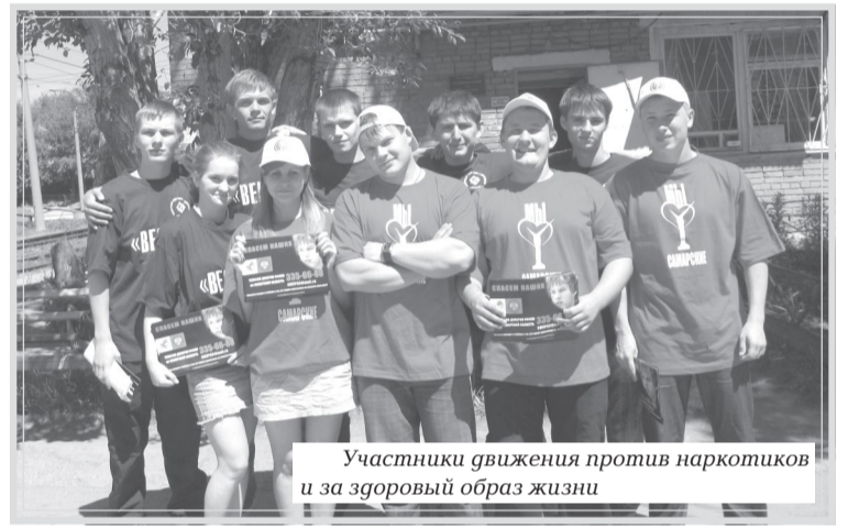
Участники движения против наркотиков и за здоровый образ жизни