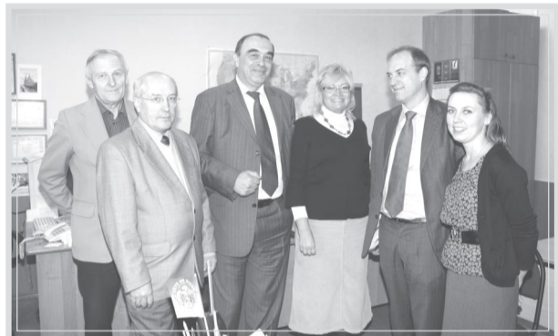
Н. Мазек (второй справа) с сотрудниками университета

3 декабря СамГТУ посетил г-н Николя Мазек, атташе по академическому сотрудничеству посольства Франции в Москве. Визит проходил в рамках закрытия перекрестного Года России – Франции на территории Самарской области.