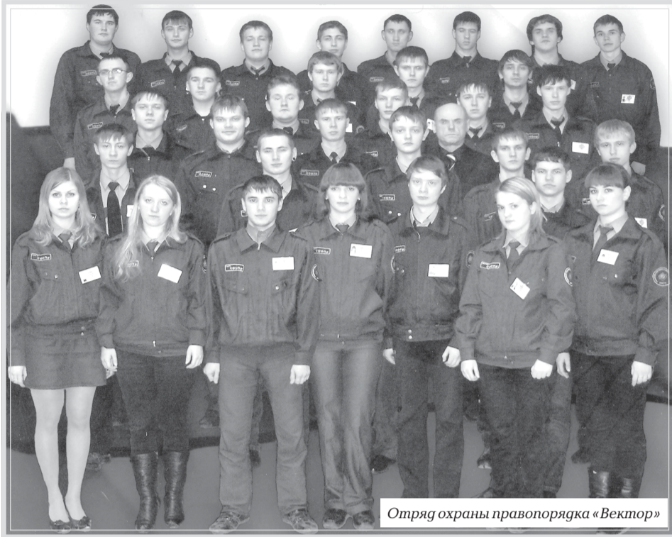
Отряд охраны правопорядка «Вектор»